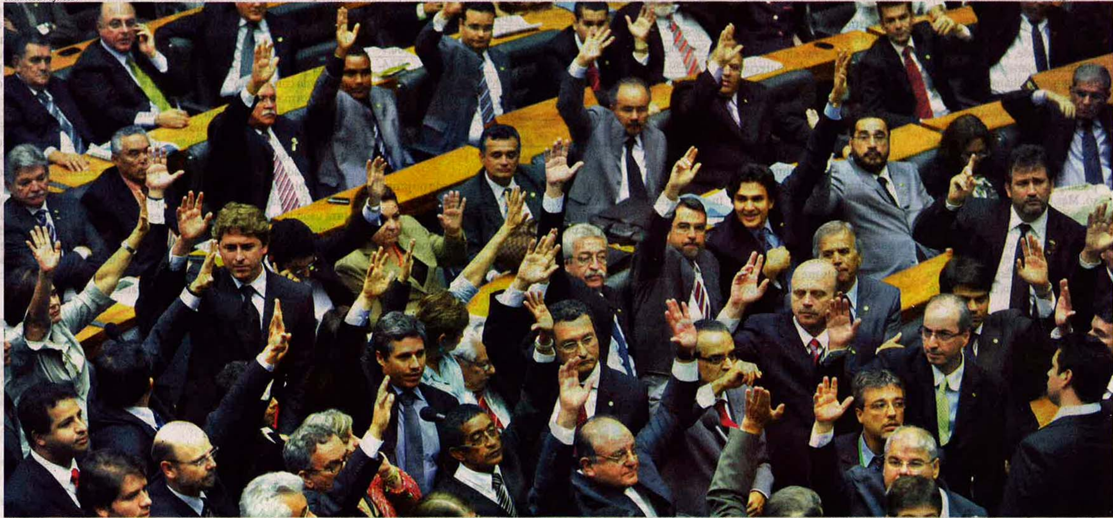
Plenário da Câmara dos Deputados em fevereiro de 2011: parlamentares da base aliada votam a proposta que permite que o governo estabeleça o reajuste do salário mínimo por decreto. Projeto foi aprovado do jeito que o Palácio do Planalto queria.

Levantamento com base em 92 votações em 2011 na Câmara Federal mostra que os partidos aliados acompanharam o PT, legenda da presidente Dilma, em 90% dos projetos